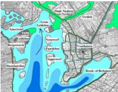
Situatie circa 1600. Rechts van het midden de slingerende Groenedijk